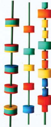
20. Stangen mit und ohne Schützringe 100cm