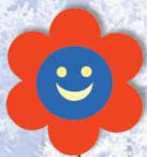
9. Blume 42x42x38 cm