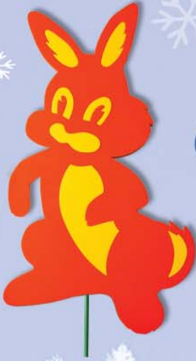
2. Maxi Hase 100x65x38cm