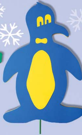
5. Maxi Pinguin 100x65x38cm