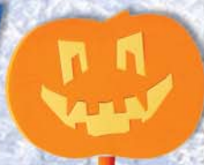
11. Kürbis 39x28x38cm