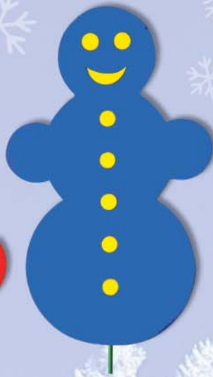
3. Maxi Schneemann 100x65x38cm