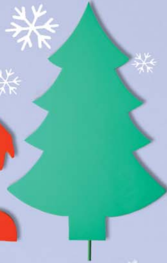
7. Maxi Baum 100x65x38cm