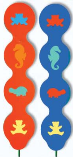
18. Stange mit vier Motiven 100x210x38cm