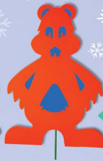
6. Maxi Biber 100x65x38cm