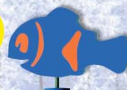
16. Fisch Nemo 40x22x38cm