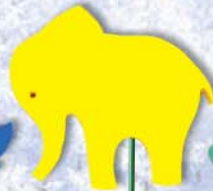
13. Elefant 30x26x38cm