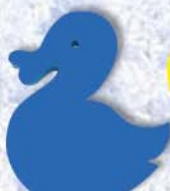
12. Ente 32x26x38cm