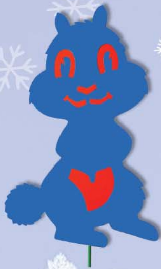
1. Maxi Eichhörnchen 100x65x38cm