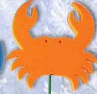
17. Krebs 25x27x38cm