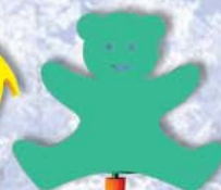
14. Bär 34x29x38cm