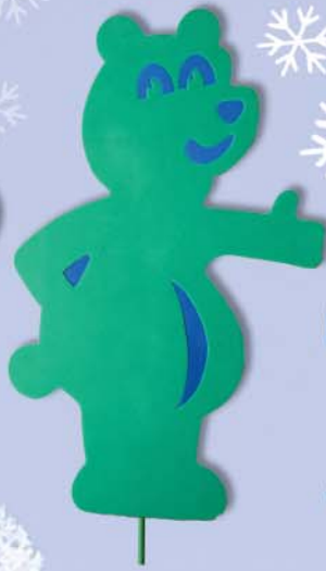
4. Maxi Bär 100x65x38cm