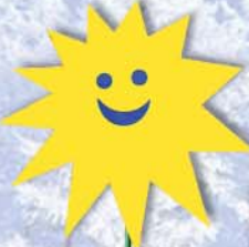
8. Sonne 45x45x38cm