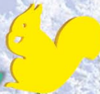
15. Eichhörnchen 34x30x38cm